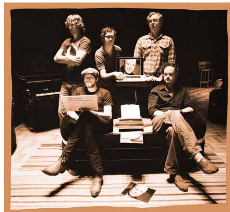
Ben Folds neustes musikalisches Experiment heißt „Lonely Avenue“, welches in Kooperation mit Nick Hornby entstand.

Stimme. Viele seiner Lieder sind nachdenklich und von einer gewissen melancholischen Stimmung durchzogen. In seinem 2005 veröffentlichten Album „Songs for Silvermann“ widmete er beispielsweise den Song Late dem verstorbenen Musiker Elliott Smith, den Folds sehr bewunderte. Neben seinen herausragenden Fähigkeiten am Piano, beherrscht er nebenbei fast jedes beliebige andere Instrument. Für sein Album „Rockin‘ the Suburbs“ spielte er die meisten Instrumente selber ein.